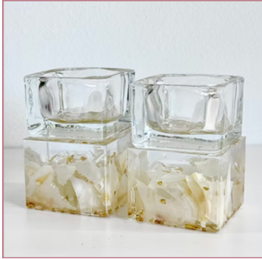
Square long (לנרות תה / קפלויות)