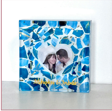
Square 2 16.5x16.5x5 ס"מ