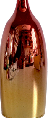
12. Rose gold